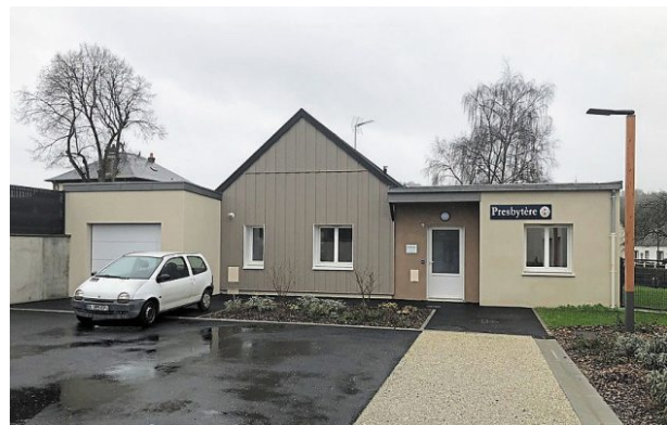
L'ancien presbytère est désormais une maison d'assistantes maternelles. Un nouveau bâtiment a été construit.