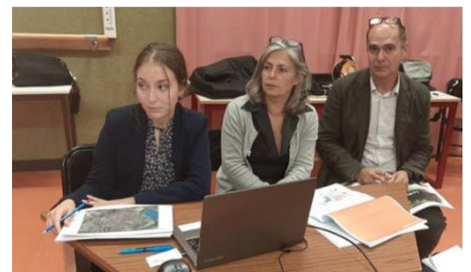
Les trois intervenants qui ont exposé le projet.