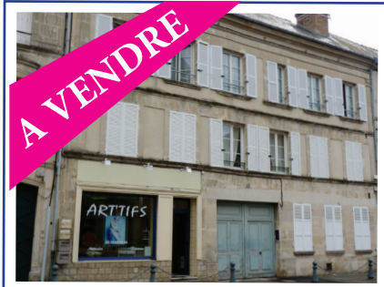
rue Saint Martin / Argentan

Conformément aux articles L 443-11, 3ème alinéa et R. 443-12 du code de la construction et de l'Habitation,