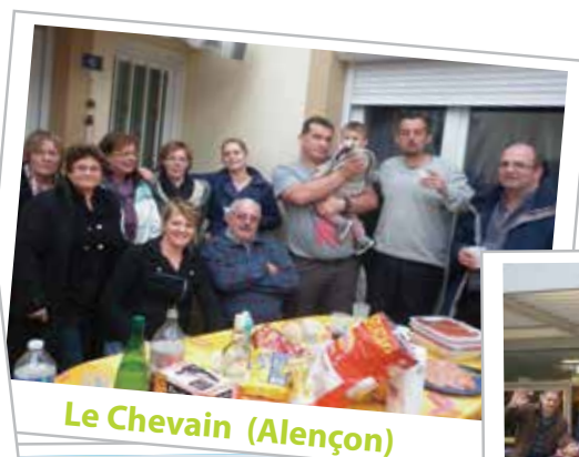
Le Chevain (Alençon)