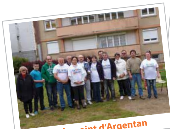
Place du point d'Argentan