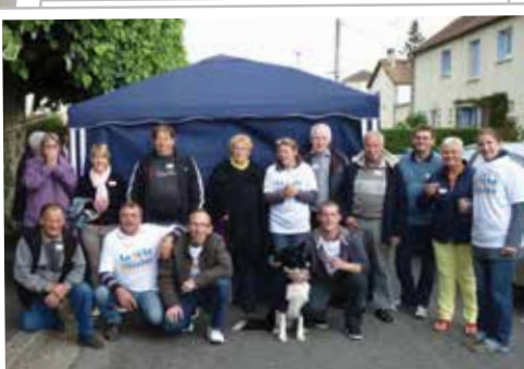
Rue Pasteur (Argentan)