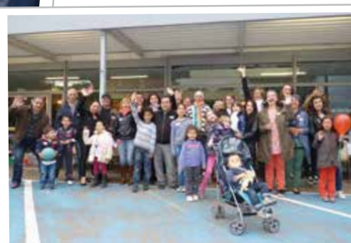
Rue de Savoie (Argentan)