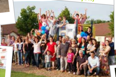
Place Montaigne (Arçonnay)