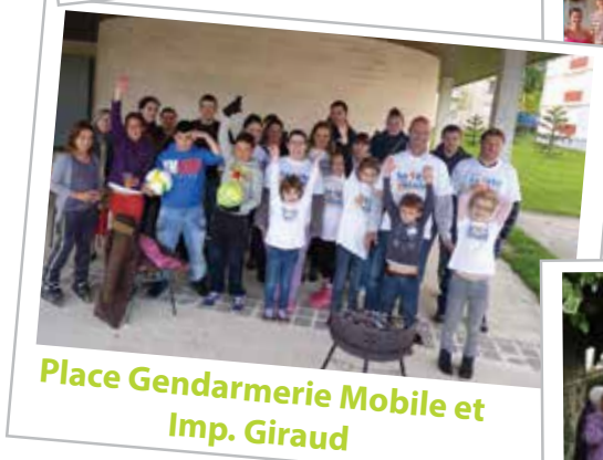
Place Gendarmerie Mobile et Imp. Giraud